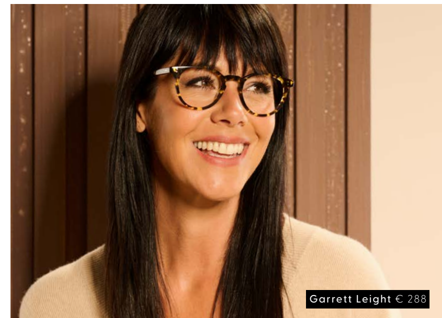
Garrett Leight € 288

Ze helpen je graag om samen de perfecte bril uit te kiezen en je het perfecte zicht te bezorgen.