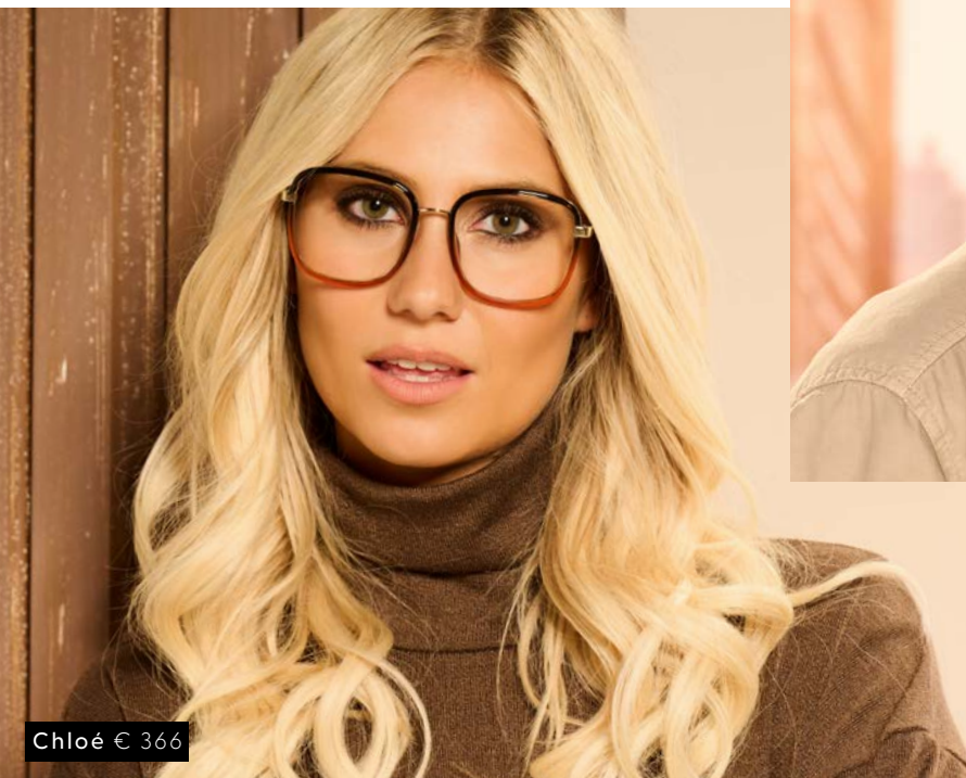
Chloé € 366