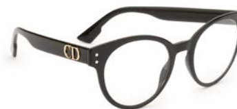
DIOR € 325

In de jaren '40 kwam Oliver Goldsmith op het idee om brilmonturen te maken van acetaat. Dit nieuwe materiaal en zijn extravagante ontwerpen vielen in de smaak bij de legendarische iconen Audrey Hepburn en Grace Kelly.