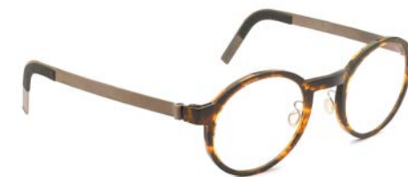
LINDBERG € 530

Om tot een modieus motief voor een bril te komen, worden verschillende kleuren acetaatblokjes in een motief gelegd, verdund met aceton en terug samengeperst tot een plaat. Deze platen moeten enkele weken tot maanden drogen.