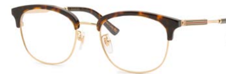
GUCCI € 333

Kunststofbrillen zijn er in alle kleuren en maten. Van minimalistisch mat tot mooi gekleurde patronen. Ze zijn er ook in alle prijsklassen. Cellulose-acetaat geniet de voorkeur van vele brillendesigners.