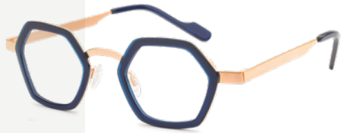
ANNE & VALENTIN € 426