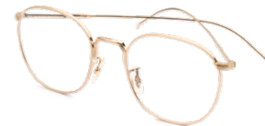
OLIVER PEOPLES € 285