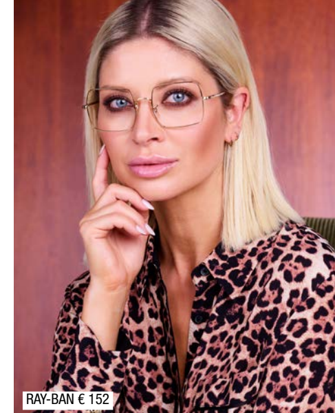
RAY-BAN € 152