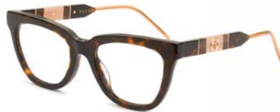
3 GUCCI € 411