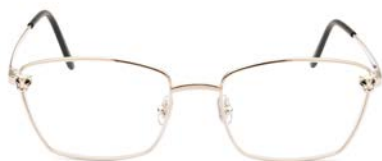
CARTIER € 736