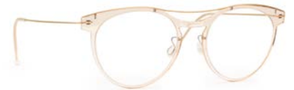
6 LINDBERG € 499