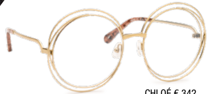
CHLOÉ € 342