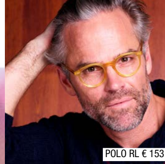
POLO RL € 153

*Vraag naar de voorwaarden in de winkel. Hiervoor kan een oogonderzoek vereist zijn, dat door je oogzorgspecialist in rekening wordt gebracht. Exclusief eventuele aanpasskosten. †Perez-Gomez J, Giles T. European survey of contact lens wearers and eye care professionals on satisfaction with a new water gradient disposable contact lens. Clin Optom. 2014; 6:17-23. © 2019 Novartis MR2019-196 03/2019