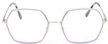
4 TOM FORD € 330

STRAAL UIT WIE JIJ BENT, BIJ ELKE OUTFIT EN OP ELKE GELEGENHEID