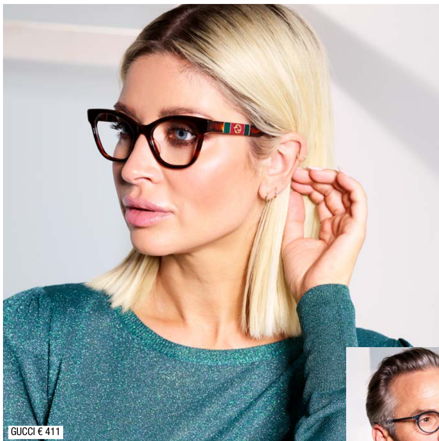
GUCCI € 411