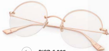
1 DIOR € 385