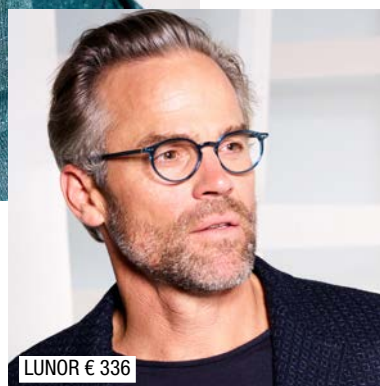
LUNOR € 336