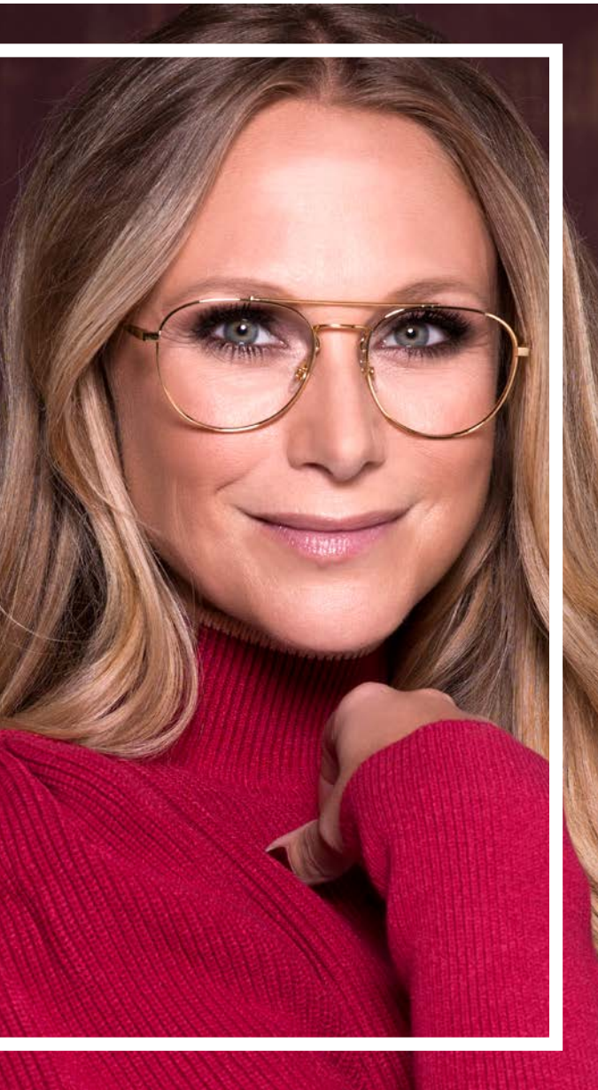
RAY-BAN € 141,-