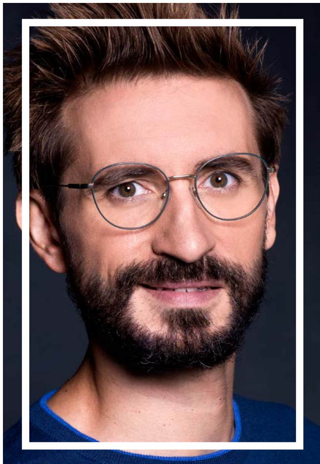
PRADA € 240,-