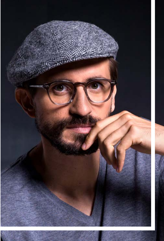
OLIVER PEOPLES € 318,-