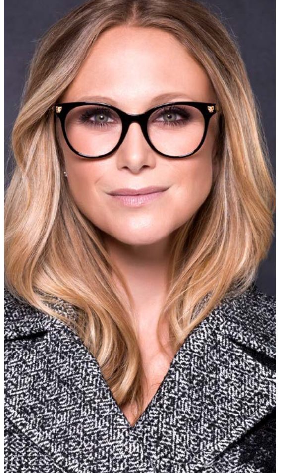
CARTIER € 555,-