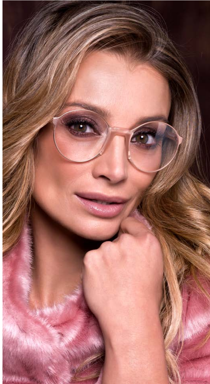
ANDY WOLF € 379,-